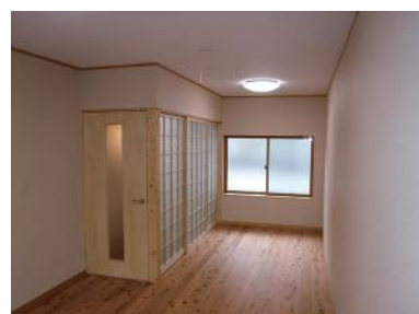
木の温かみのある室内に変わりました