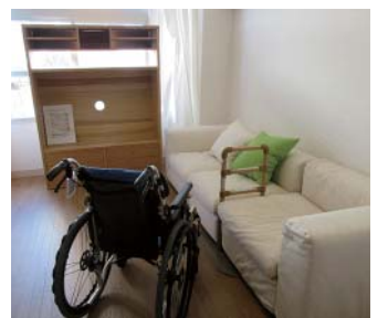
車椅子から移動しやすい高さのソファ

略会議提言(平成26年1月)」に示された7つの戦略の一つです。特定の地域をモデルとして重点的に具体化し、複数のモデル地域で取組まれているとのこと、3か所のモデル事業を見学させていただきました。