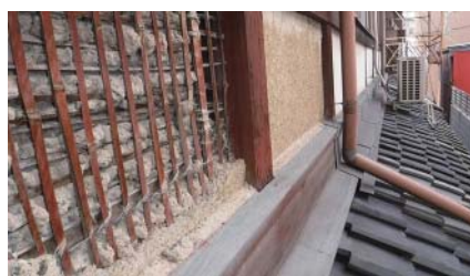
修復前の外壁 ↓ 修復後

工事の依頼主の現在のお住まいは、東京赤坂。普段は都会暮らしですが、空家になっていた実家の京都の家も大事にしたいとの思いから改修することにしました。