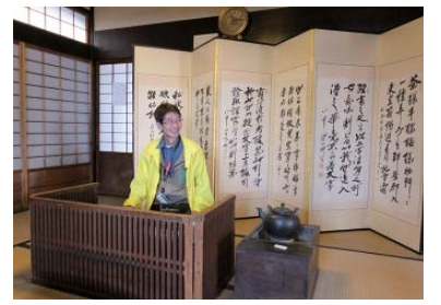
あさが来た(朝ドラではありません)