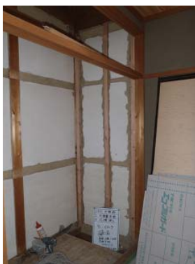
土壁を撤去し柱に耐震金物を取付

新協建設は、数か月前に堺市で耐震改修工事を経験済で、堺市のチェック事項、写真の必要な箇所、申請書類なども要領よく、順調に工事を進めることが出来ました。気候が良い10、11月の工事とはいえ、住まいながらの改修工事なので、お客様の負担を心配していたのですが、最小の工期ですみ、非常に助かりました。お客様も喜んでいらっしゃいます。