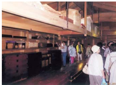
五個荘商人の生活・文化を見学

本社版「住まいの友」にも記事があります。写真は、お馴染みの参加者お2人からいただきました。▼滋賀へはよく出かけますが今回のところは初めてです。近江商人の里のひなびたたたずまいの中に、じっくりと居を構える街並みに心ひかれました。▼淡水魚中心の昼食